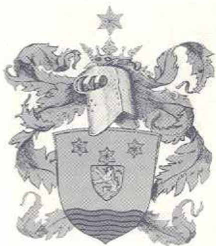
Lamaison van Heenvliet.